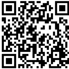
QRCode ระบบติดตามคดีรัฐธรรมนูญ (e-Tracking System)

ในปัจจุบัน “ศาลรัฐธรรมนูญ” ในฐานะที่เป็น “หน่วยงานในกระบวนการยุติธรรม” ได้จัดให้มีระบบเทคโนโลยีสารสนเทศ ได้แก่ ระบบงานคดีรัฐธรรมนูญอิเล็กทรอนิกส์ (e-Filing) แล้ว แต่อย่างไรก็ตาม แต่ยังมีข้อจำกัดที่ให้บริการแก่เฉพาะ “คู่กรณี” ที่ลงทะเบียนการใช้งาน และต้องดำเนินการทางคดีอย่างต่อเนื่องเท่านั้น ซึ่งเป็นข้อจำกัดและยังไม่ครอบคลุมกับการให้บริการตามความวัตถุประสงค์ของพระราชบัญญัติกำหนดระยะเวลาดำเนินงานในกระบวนการยุติธรรม พ.ศ. 2565 มาตรา 8 ดังนั้น จึงจำเป็นต้องมี “ระบบติดตามคดีรัฐธรรมนูญ” (Case tracking system) เพื่อมาอำนวยความสะดวกแก่ “ผู้มีส่วนเกี่ยวข้อง” ให้สามารถเข้าถึงข้อมูลได้โดยสะดวกและรวดเร็ว ทั้งนี้ “ผู้มีส่วนเกี่ยวข้อง” สามารถติดตามผ่าน “ระบบติดตามคดีรัฐธรรมนูญ” (e-Tracking System)