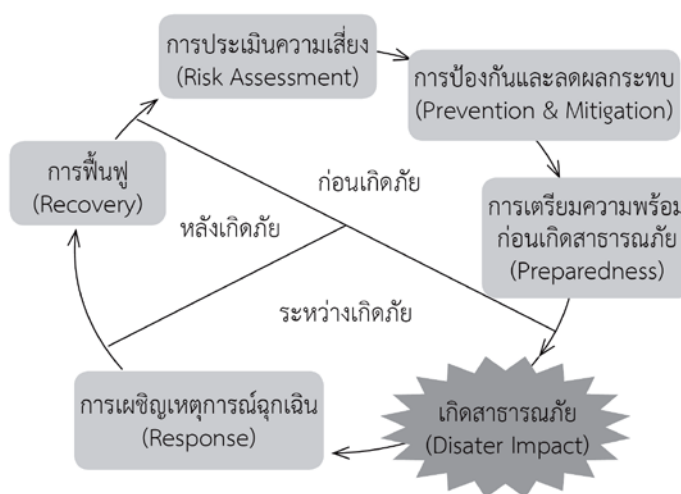
วงจรการบริหารจัดการความเสี่ยงจากสาธารณภัย ๑๑

ความเสี่ยงจากสาธารณภัย (disaster risk) หมายถึง โอกาสหรือความเป็นไปได้ในการได้รับผลกระทบทางลบจากการเกิดสาธารณภัย โดยผลกระทบสามารถเกิดขึ้นกับชีวิต สุขภาพ การประกอบอาชีพ ทรัพย์สิน และบริการต่างๆ ในระดับบุคคล ชุมชน สังคม หรือประเทศ การบริหารจัดการความเสี่ยงจากสาธารณภัย (DRM) เป็นการจัดการกับปัจจัยที่ทำให้เกิดความเสี่ยง ผ่านมาตรการต่าง ๆ ที่ช่วยทำให้ผลกระทบที่อาจเกิดขึ้นจากสาธารณภัยได้ลดน้อยลงที่สุดเท่าที่จะเป็นไปได้ โดยสามารถแบ่งมาตรการออกเป็นสามระยะสำคัญ ได้แก่ ระยะก่อนเกิดภัย ระยะระหว่างเกิดภัย และระยะหลังเกิดภัย